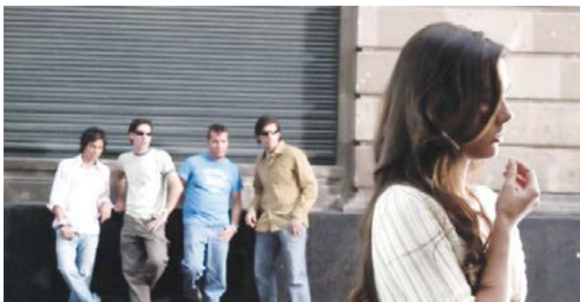
El informe, se realizó con muestras tomadas en La Plata, Ezeiza, Esteban Etcheverría y Lomas de Zamora.

En base al testimonio de 300 mujeres de distintas edades que residen en dicha localidades bonaerenses, se evidencia que el hostigamiento comienza en la preadolescencia. En el relevamiento se detectó que 8 de cada 10 mujeres sufrieron situaciones de acoso callejero y que en el 97% no se lo de-