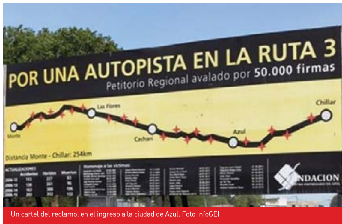
Un cartel del reclamo, en el ingreso a la ciudad de Azul.

Los planos de la autopista fueron presentados por el administrador general de Vialidad Nacional, Javier Iguacel, en el marco de un encuentro con el Intendente azul-