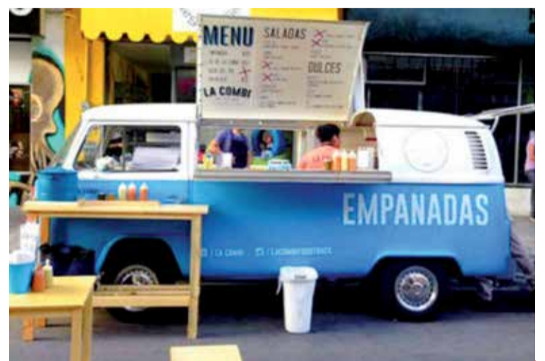
La iniciativa incorpora una serie de requisitos que deben cumplir quienes busquen el permiso para poder instalar los vehículos en la vía pública.