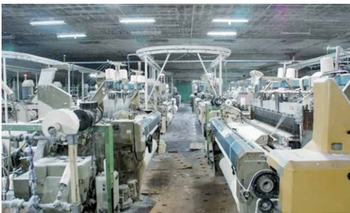
Un reciente informe del Centro de Economía Política Argentina describe la situación del sector textil a nivel nacional.

Se agrega, según datos de la Superintendencia de Riesgos de Trabajo (SRT), que la expulsión de trabajadores se concentró principalmente en grandes empresas. En tal sentido, CEPA advierte que "las empresas del segmento pequeño, con menos de 100 trabajadores, han despedido a 0,38 por ciento de su plantilla durante el año 2016". (InfoGEI)