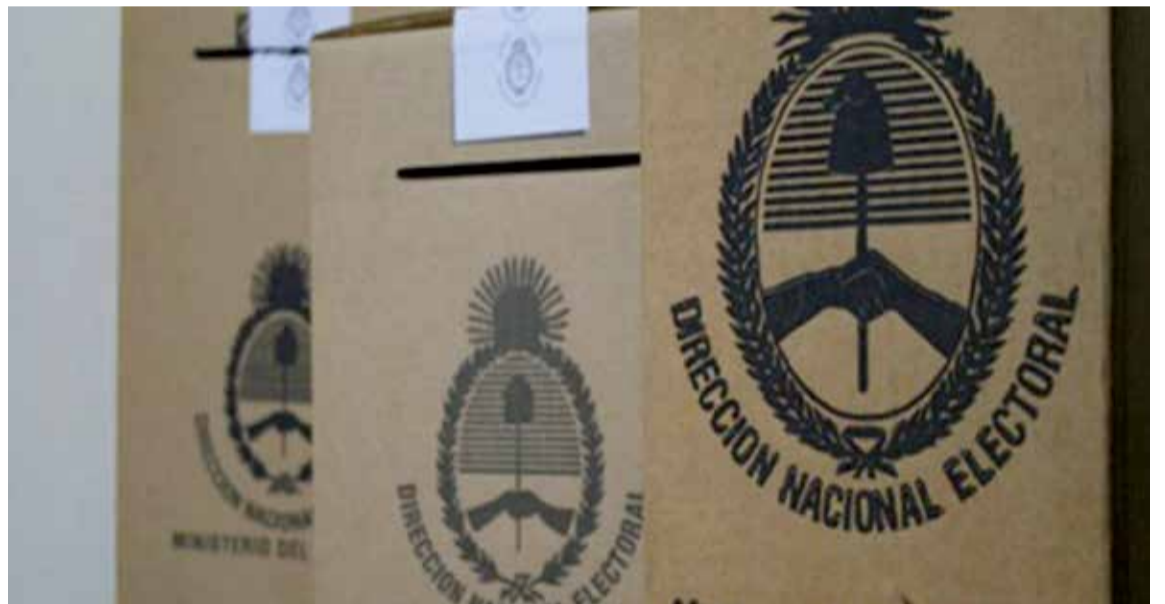
Las alianzas están inscriptas y ahora solo resta esperar las listas de candidatos.

La Junta Electoral bonaerense aprobó el cronograma electoral completo, tanto para las Primarias Abiertas, Simultáneas y Obligatorias (PASO) que se desarrollarán el 13 de agosto, como para los co-