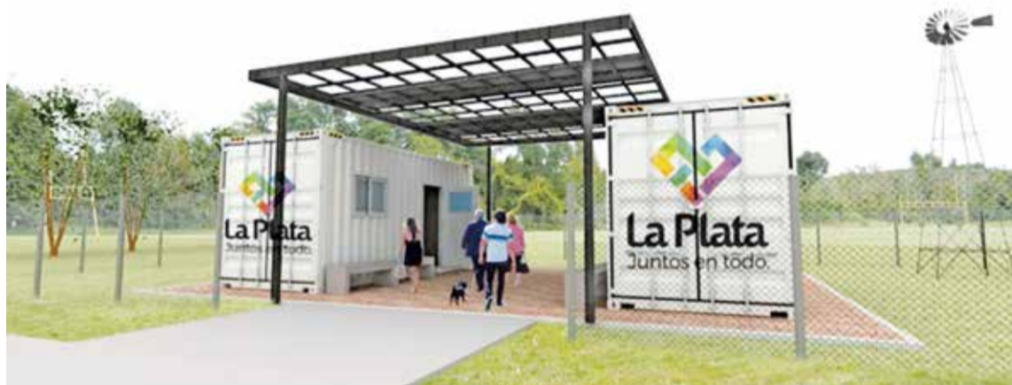
La inauguración está prevista para agosto próximo.

Desde la Municipalidad de La Plata, que realiza el proyecto en conjunto con el Gobierno nacional, informaron que prevén inaugurarla para agosto próximo. “La iniciativa tiene como objetivo acompañar a