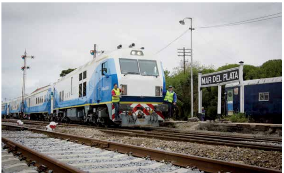
Desde el 1 de julio el servicio de trenes llegará a Mar del Plata, mientras que desde el día 10 del mismo mes se sumarán frecuencias a Junín y el 17 a Bahía Blanca.

Un año sin uso, pero con gasto La semana pasada el portal de noticias Infocielo había publicado una información de que a pesar de que los servicios están paralizados Ferrobaires, le demandó a la Provincia 1.138 mi-