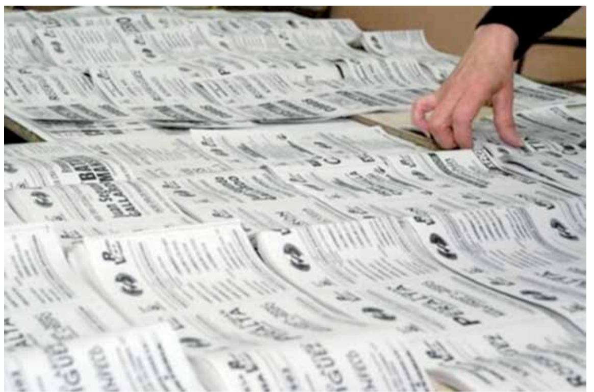
La elección de este año, definirá el futuro rumbo de la Argentina.

En la primera sección electoral, que comprende 23 distritos del norte y oeste del Conurbano