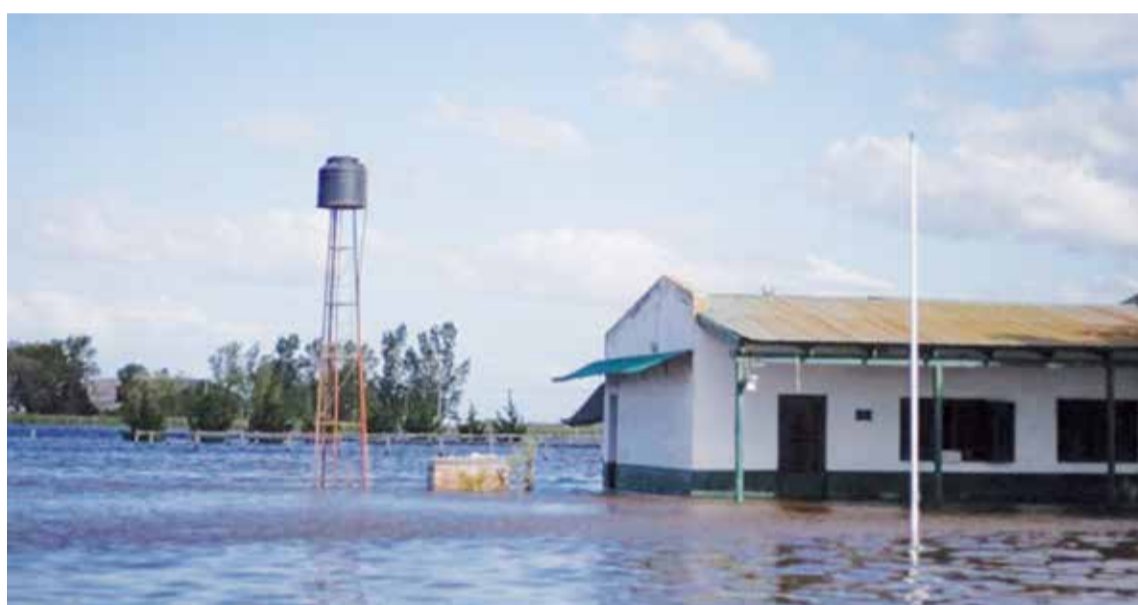
El distrito padece inundaciones desde hace 15 meses.

modificarse un poco porque no es lo mismo que estar de manera presencial, no es tan personalizado pero es posible