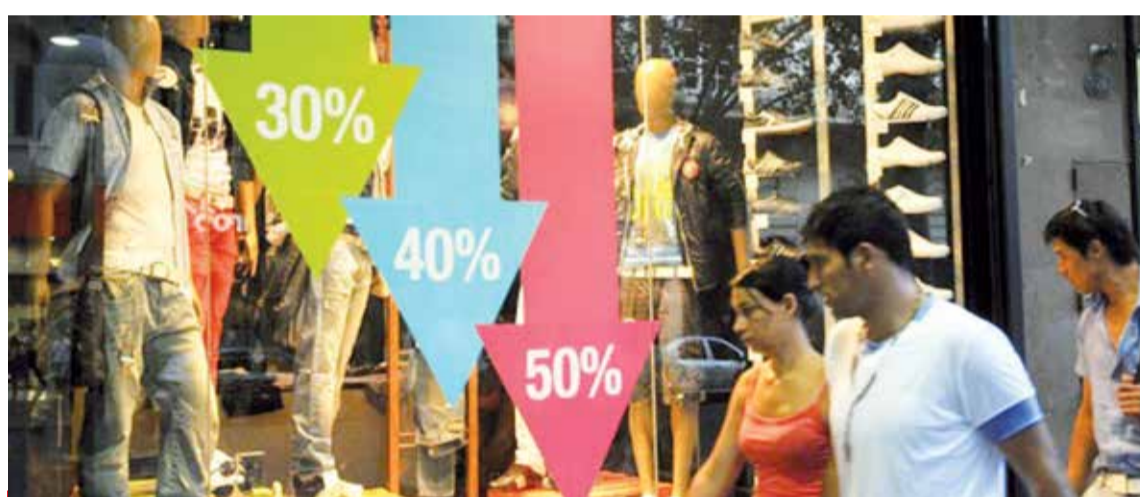
Los datos surgen de un informe realizado por la Federación Económica de la provincia de Buenos Aires (FEBA).

El dato surge de un informe realizado por la Federación Económica de la provincia de Buenos Aires (FEBA) que, además en su análisis advierte que el plan Precios Transparentes, impulsado por el Gobierno Nacional con el objetivo de bajar los precios al contado, "hasta el momento no ha funcionado de acuerdo a lo esperado, impactando negativamente en la actividad".