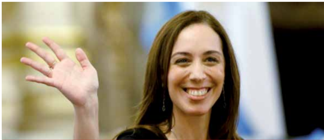
El Fondo del Conurbano fue creado en 1992 para devolverle a Buenos Aires los puntos de coparticipación que había perdido en los años 80, pero en 1996 fue congelado en la cifra que cobra.

La Provincia podría recuperar unos $300.000 millones, que surgen del reclamo por el retroactivo