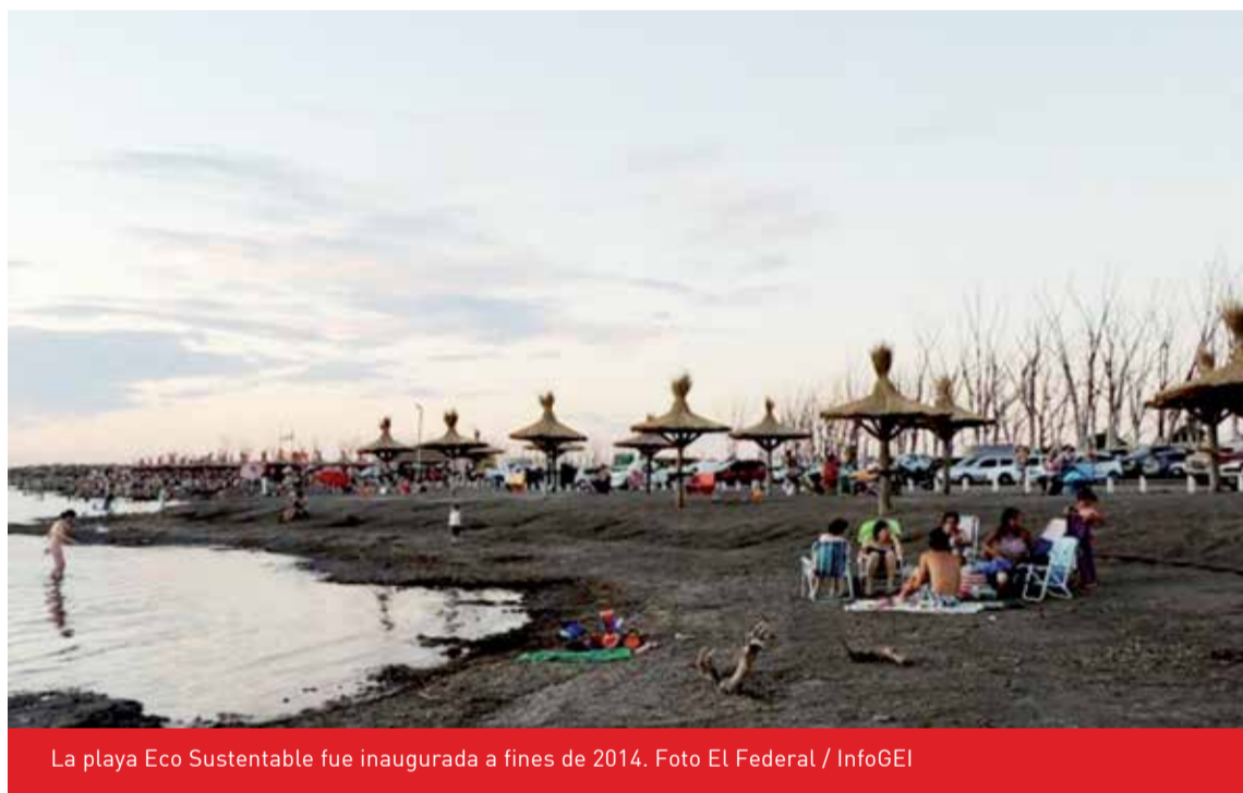
La playa Eco Sustentable fue inaugurada a fines de 2014.

La preocupación por el destino de este balneario pionero preocu-