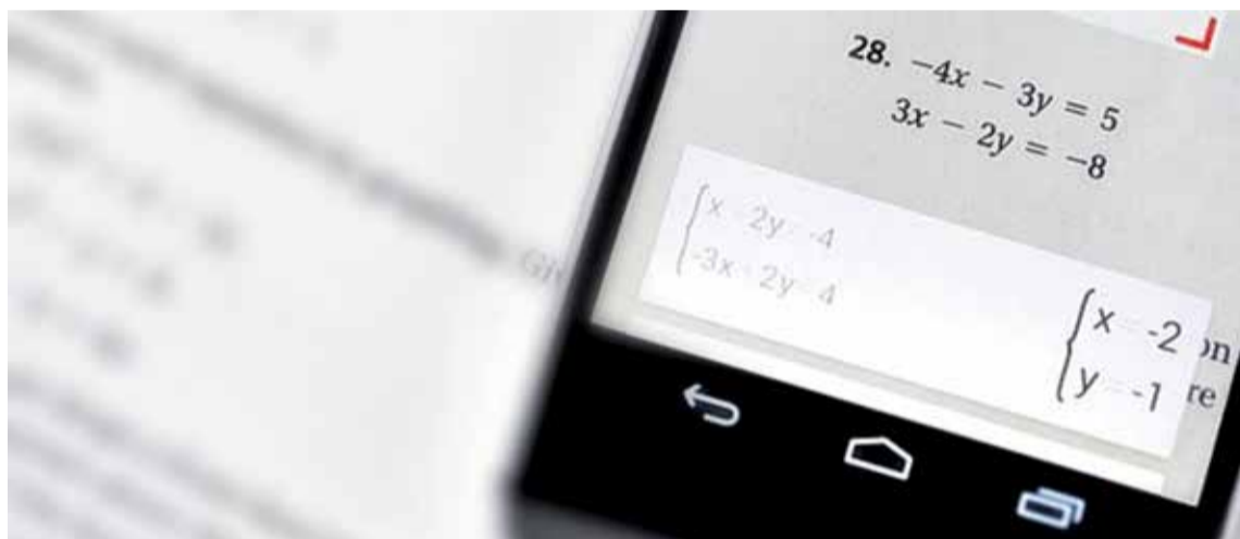
La iniciativa de usar aplicaciones para teléfonos móviles surgió con el propósito de transformar la clase de Matemática en un espacio innovador.

Concretamente, esta novedosa herramienta de enseñanza permite al docente elaborar una plantilla con problemas, ejercicios y preguntas, plasmados sobre una plataforma informática a la que los alumnos acceden a través de sus teléfonos celulares. Se puede optar porque los alumnos resuelvan los problemas en forma individual o en grupo, siempre bajo un esquema