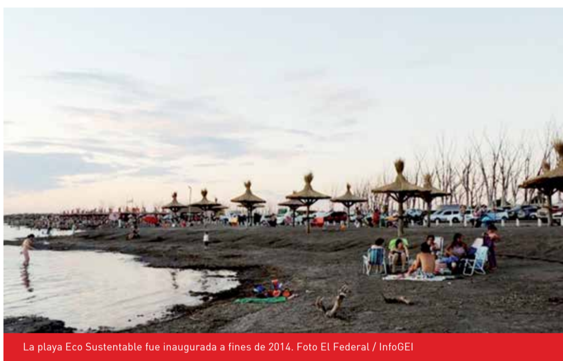
La playa Eco Sustentable fue inaugurada a fines de 2014.

La preocupación por el destino de este balneario pionero preocu-