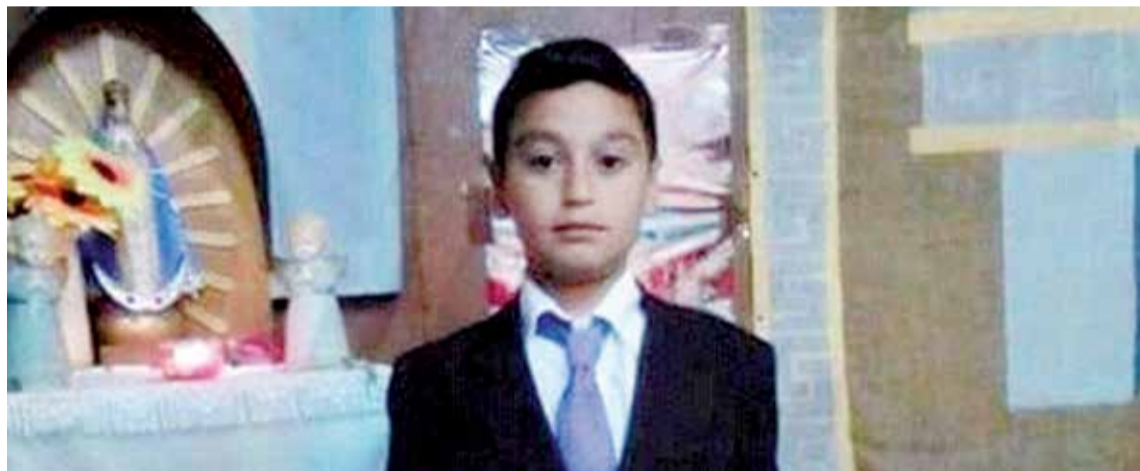
Al momento de su desaparición, el nene vestía un jogging negro, zapatillas azul oscuras, una campera de polar azul y llevaba una mochila gris.

paro de colectivos Elías faltó algunos días a su escuela, la Técnica Nº 1, hasta que el martes pasado, cuando el servicio comenzó a funcionar con algunas unidades, él y su hermana tomaron el 520.