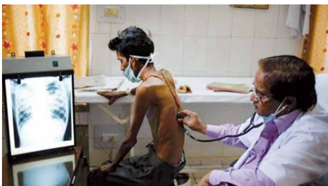
En el transcurso del año se incrementaron los casos de tuberculosis, una enfermedad respiratoria que suele asociarse a deficiencias alimenticias y habitacionales.

"Veníamos de un período de descenso, después se estabilizó y este año aumentó. Hay algunas particularidades. Creo que en Luján hubo una gran cantidad de asentamientos últi-