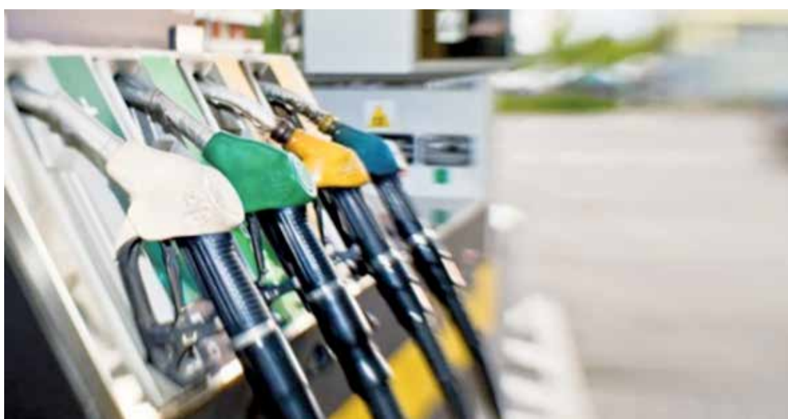
Por la medida, las estaciones de servicio de La Pampa venden los combustibles a precios considerablemente más bajos que sus pares bonaerenses.

una zona exenta para que el combustible sea consumido en ella, pero se han